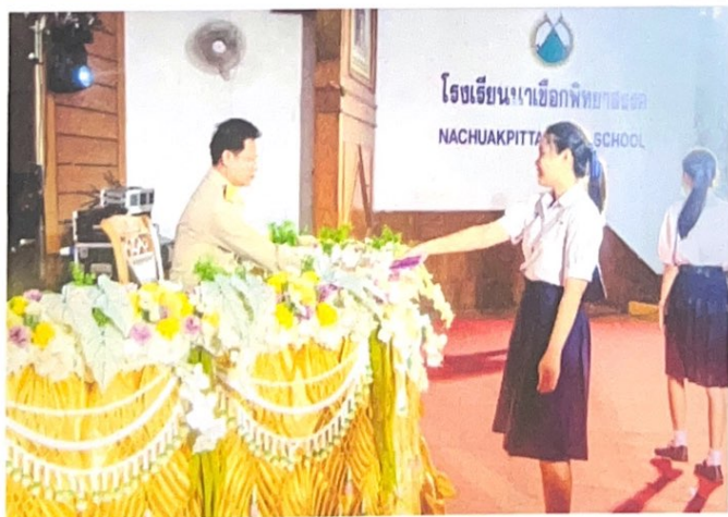
ตัวแทนระดับชั้นมัธยมศึกษาปีที่ 3 และ 6 มอบอนุสรณ์รุ่นให้กับทางโรงเรียนนาเชือกพิทยาสรรค์