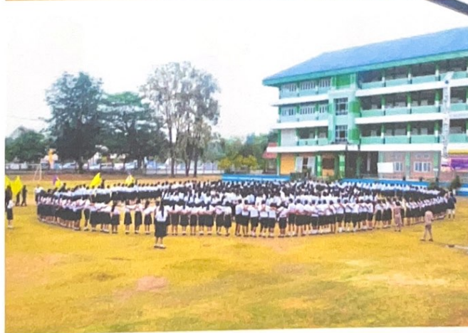
กิจกรรมการบวงสรวง โดยนักเรียนชั้นมัธยมศึกษาปีที่ 4-5 เพื่อแสดงความรัก ความกลมเกลียวระหว่าง พี่น้องร่วมสถาบัน พร้อมทั้งร้องเพลงสถาบันร่วมกัน