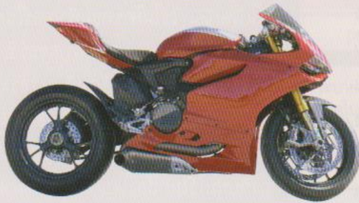
รถจักรยานยนต์

ให้นักเรียนเลือกเทคโนโลยีที่สนใจ 1 อย่าง จากตัวอย่างที่กำหนดให้ เพื่อวิเคราะห์การทำงานของเทคโนโลยี แล้วเขียนแผนภาพแสดงการทำงานในรูปแบบของระบบทางเทคโนโลยี โดยระบุระบบย่อยที่เกี่ยวข้องอย่างน้อย 3 ระบบ พร้อมอธิบายความสัมพันธ์ของระบบย่อยเหล่านั้น