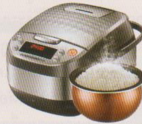
หม้อหุงข้าวดิจิทัล