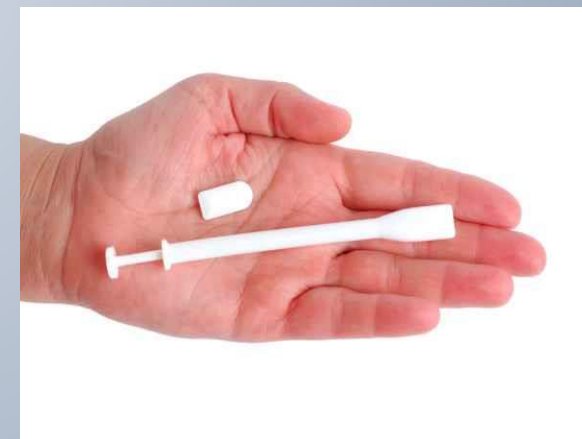
ช่องคลอด