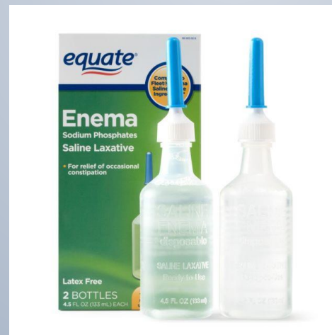
ทวารหนัก