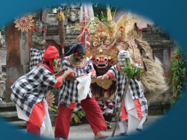
ละครบารอง