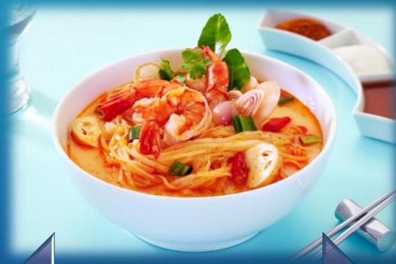
อาหารไทย

อาหารของโลกตะวันตกเน้นความสะดวกสบาย เน้นแป้ง และเนื้อสัตว์ ส่วนโลกตะวันออกรู้จักนำสมุนไพรมาปรุงเป็นอาหาร มีความพิถีพิถันในการปรุงอาหาร