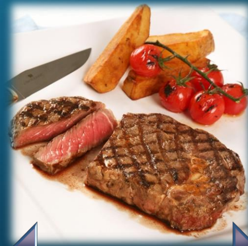
อาหารสากล