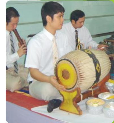
การเล่นดนตรีร่วมกัน นอกจากจะทำให้เกิดความสนุกสนานแล้ว ยังเป็นการใช้เวลาว่างให้เกิดประโยชน์ และเสริมสร้างความสามัคคีอีกด้วย

การฟังเพลงเป็นวิธีการหนึ่งที่จะช่วยผ่อนคลายความเครียดจากการเรียน การทำงาน หรือจากปัญหาความวุ่นวายต่างๆ ดนตรีจึงมีส่วนสำคัญในการปรับปรุงจิตใจให้รู้สึกเป็นสุข