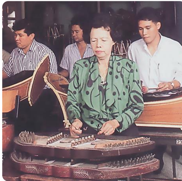
การฟังการบรรเลงดนตรีไทยอย่างตั้งใจ จะทำให้ผู้ฟังเกิดอารมณ์และความรู้สึกที่หลากหลาย ทั้งสนุกสนาน เพลิดเพลิน หรือโศกเศร้า

ใช้หลักการในการเลือกเครื่องดนตรีแต่ละประเภทให้มีความสอดคล้องกลมกลืนกัน เพื่อประสมเป็นวงดนตรี การใช้ทำนองเพลงไทยที่เหมาะสมกับงาน คำร้องที่มาจากบทร้อยกรองของวรรณคดีหรือประพันธ์ขึ้นเป็นการเฉพาะกิจในกิจกรรมนั้นๆ