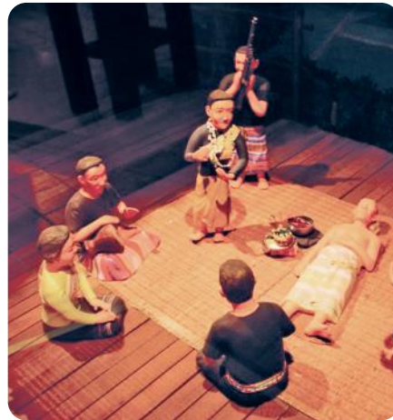
หุ่นจำลองพิธีรำผีฟ้าในภาคตะวันออกเฉียงเหนือ เป็นพิธีกรรมที่ใช้ดนตรีในการบำบัดรักษาโรคภัยไข้เจ็บ

แพทย์จะให้ผู้ป่วยเล่นดนตรี เพื่อช่วยให้การเคลื่อนไหวของกล้ามเนื้อเกิดการเปลี่ยนแปลง ในขณะที่ผู้ป่วยเองก็เพลินเพลินในการเล่นดนตรี หรือใช้วิธีการรักษาเพื่อฟื้นฟูจิตใจผู้ป่วยด้วยการฟังเพลง หรือเข้าร่วมกิจกรรมดนตรีต่างๆ เป็นการฟื้นฟูสภาพจิตใจผู้ป่วยให้ผ่อนคลายและเป็นผลดีต่อการรักษา