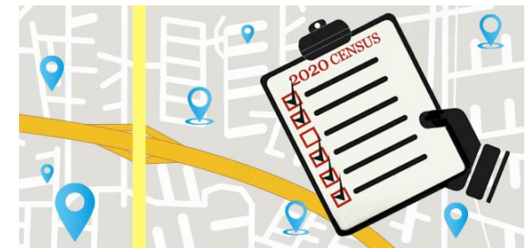
การสำมะโน