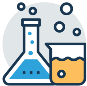
การทดลอง