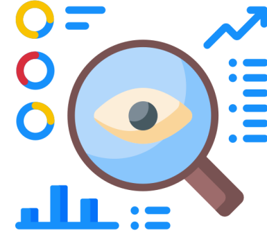
การสังเกต