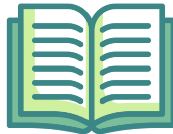
การทบทวนเอกสาร