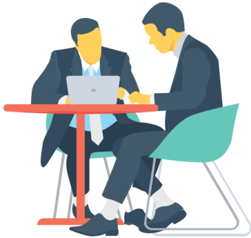
การสัมภาษณ์

เมื่อได้กรอบของปัญหาแล้ว เราต้องกำหนดประเด็นในการรวบรวมข้อมูล ซึ่งวิธีการรวบรวมข้อมูล มีหลายวิธี เช่น