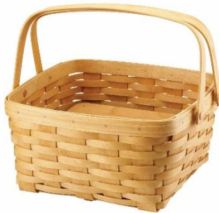
ตะกร้าไม้