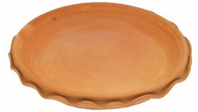
ภาชนะดินเผา