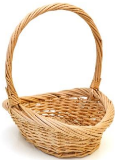
กระเช้าไม้