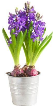
ไฮยาซินธ์