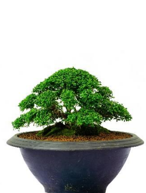
แก้วแคระ (ใบเล็ก)