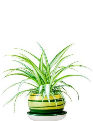
ไทรย้อยใบสับ

ร่วมกันวิเคราะห์ภาพพรรณไม้ที่ใช้จัดสวนในภาชนะ และร่วมกันแสดงความคิด โดยตอบคำถาม ดังนี้