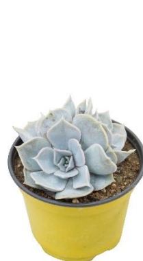
กุหลาบหิน