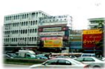
ตาดคะนอง กรุงเทพมหานคร