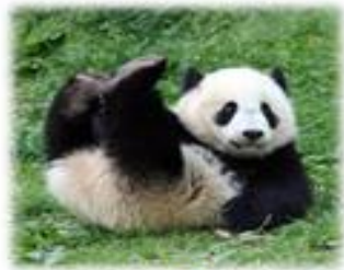
พลินปิง สวนสัตว์เชียงใหม่