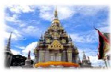
พระบรมธาตุไชยา จังหวัดสุราษฎร์ธานี