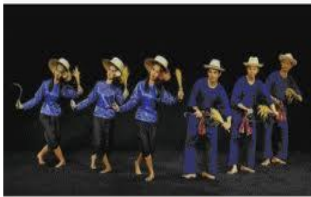
ภาพเคลื่อนไหวของการแสดงนี้สื่อถึงวิถีชีวิตการทำนาของภาคกลาง