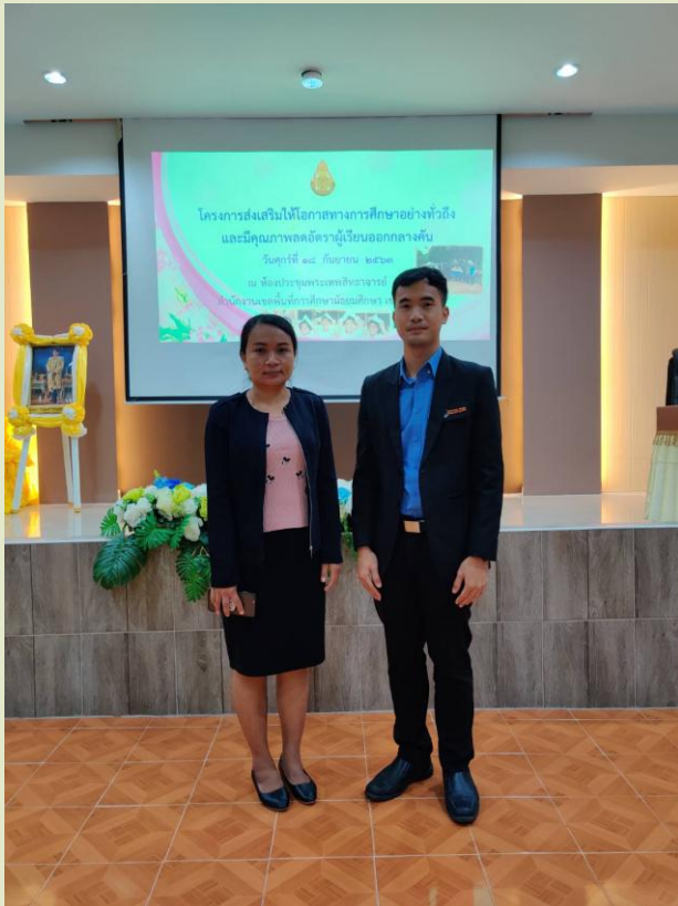
ปฏิบัติการกิจกรรมทางวิชาเกี่ยวกับการพัฒนาวิชาชีพ ครูอย่างต่อเนื่อง