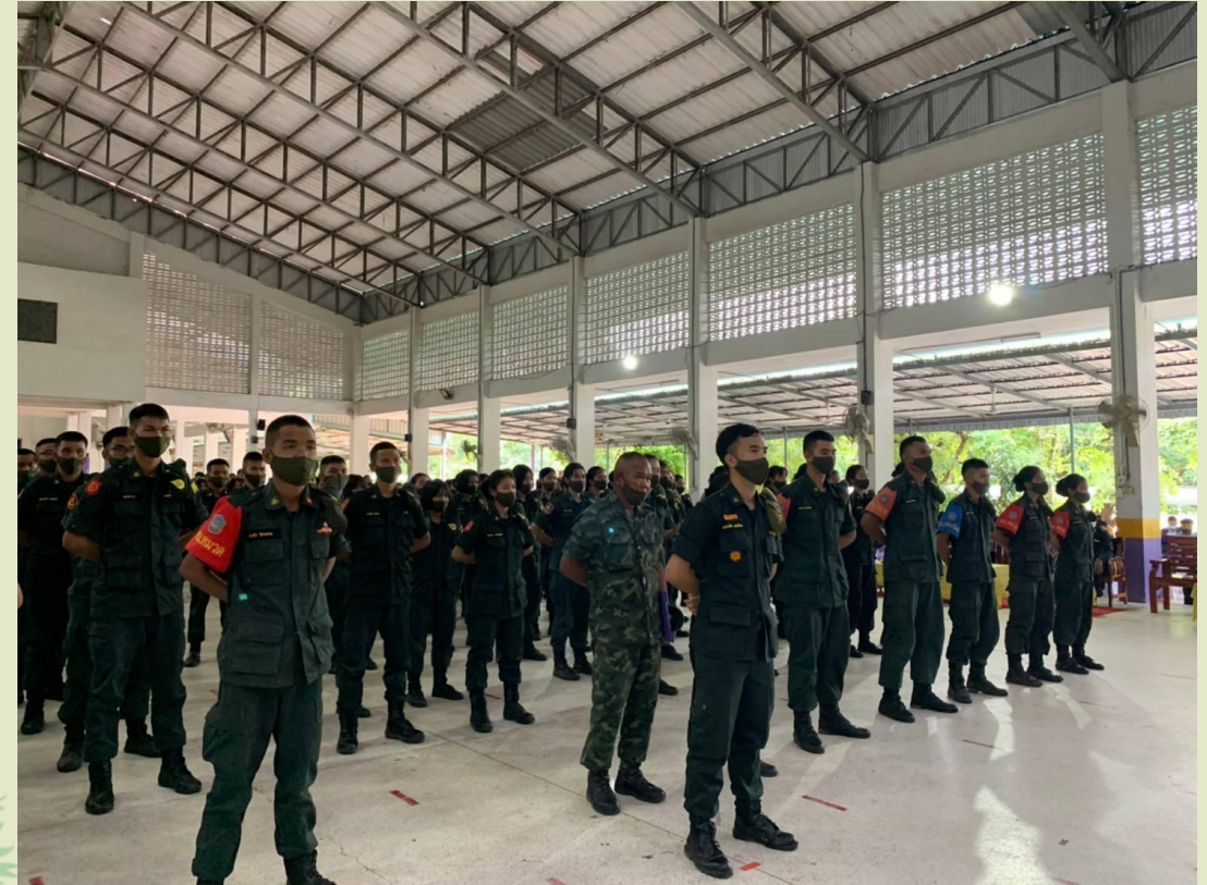
ปฏิบัติหน้าที่ในสถานศึกษาที่ได้รับมอบหมาย