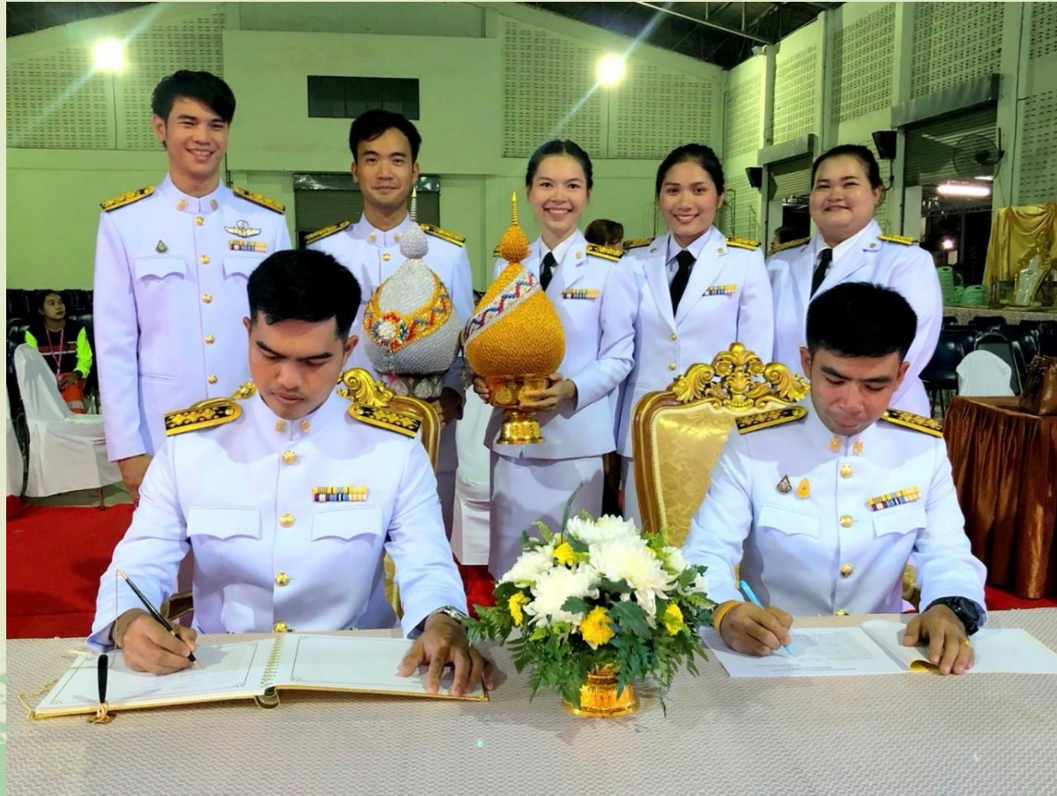
การเห็นความสำคัญในการเข้าร่วมกิจกรรม เพื่อแสดงความจงรักภักดีต่อสถาบันพระมหากษัตริย์