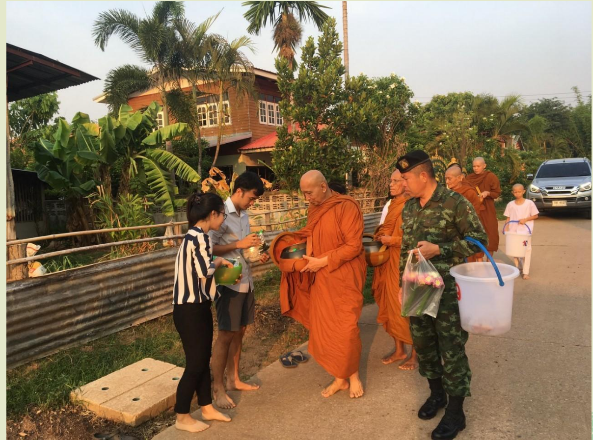
การเข้าร่วมกิจกรรมที่แสดงถึงวัฒนธรรมประเพณี อันดีงามของชาวพุทธในท้องถิ่น