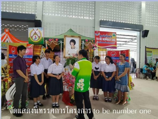
จัดแสดงนิทรรศการโครงการ to be number one