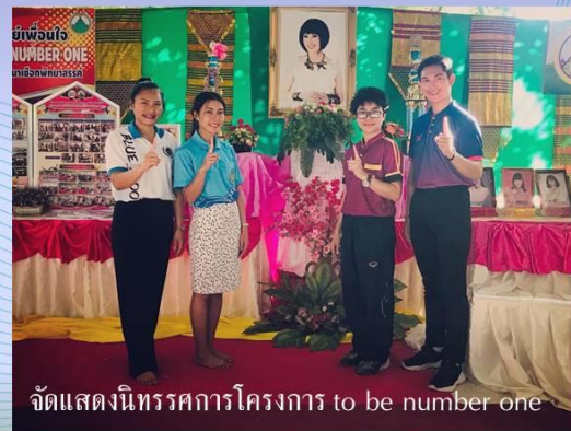
จัดแสดงนิทรรศการโครงการ to be number one